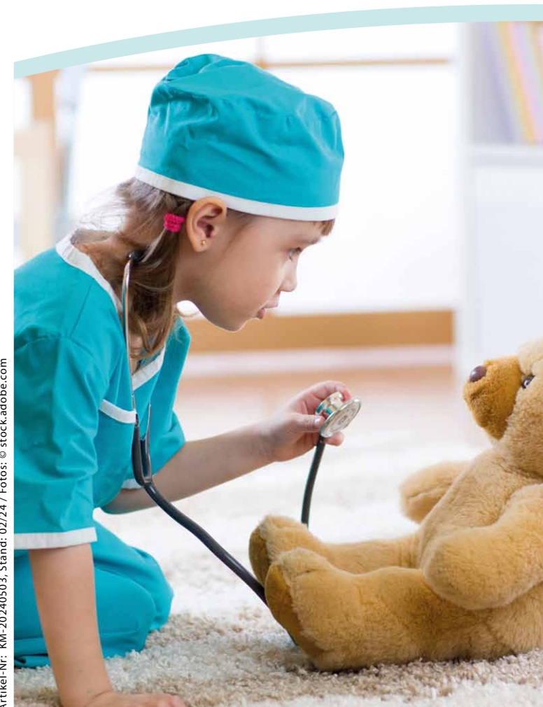
Artikel-Nr.: KM-20240503, Stand: 02/24